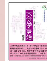
▲「大分学事始」第2集(大分学研究会刊) 2021年8月