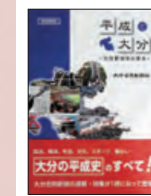
▲「平成と大分」(大分合同新聞社刊) 2019年7月