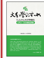
▲「大分学のおすすめ」(大分学研究会刊) 2024年6月

〔入門コース〕 100問のうち60問以上は枠で囲んだ参考書1冊の内容から出題します。