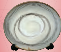
「しんけん大分学検定」特製 小鹿田焼 郷土料理本(初回検定者のみ)